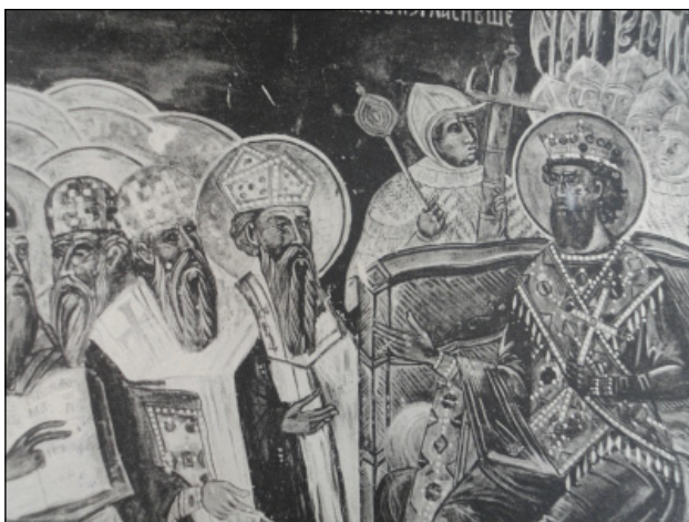
Обр. 1. Сцена „Четвърти Вселенски събор“. Църква „Св. св. Петър и Павел“, Велико Търново, XV в. (по Grabar, A. La peinture religieuse . p. 272; tabl. XLVII)