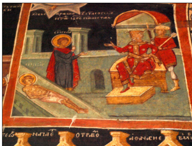
Обр. 2. Сцена от житието на св. Георги Манастирска църква „Св. Георги Победоносец“, Кремиковски манастир, 1493 г., сн. – личен архив на автора