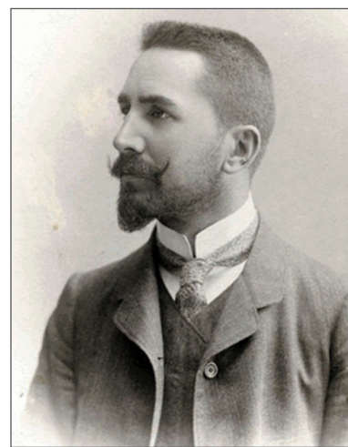
Обр. 2. Д-р Христо Татарчев – първият председател на ЦК на ВМОРО

Анализът на този драстичен пример за прилагания от ВМОРО революционен терор при събирането на парични вноски от възможните македонски българи изисква случаят да се погледне и през призмата