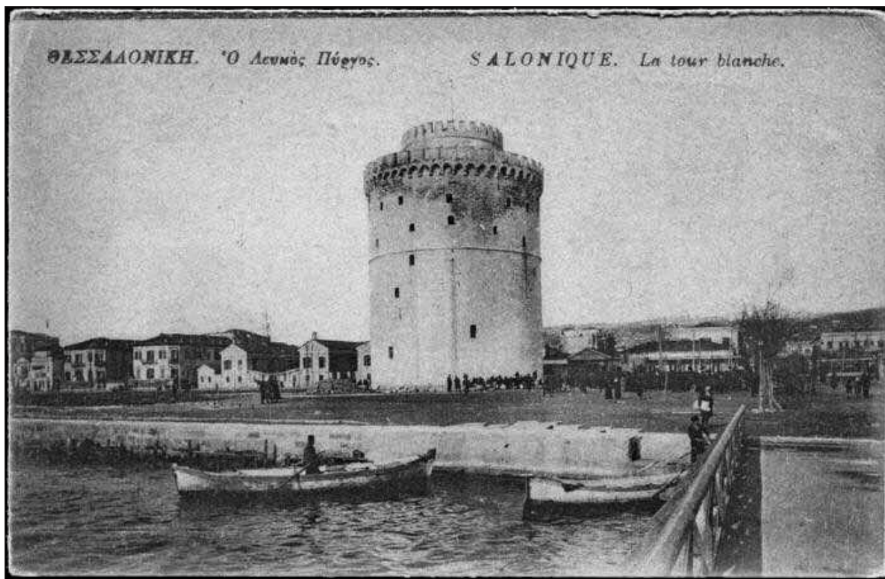
Обр. 7. Изглед от Солун в края на XIX век (ретро фотография)

ния комитет на ВМОРО пълния размер на определения му революционен налог. Този достолепен епилог на „случая Пенушлиев“ е изстрадано послание към ескалиращия радикализъм спрямо оформилия се български стопански елит, който е естествена база на българския консервативен национализъм в Македония и Одринска Тракия. Проследеният епизод от революционния терор на ВМОРО илюстрира и честата липса на елементарна тактичност, предизвикваща в чисто психологически аспект ответни реакции на засегнатото достойнство.