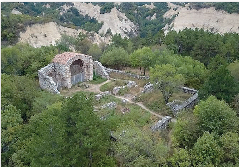
Обр. 1. Църква „Св. Никола“. Изглед (по К. Георгиев)