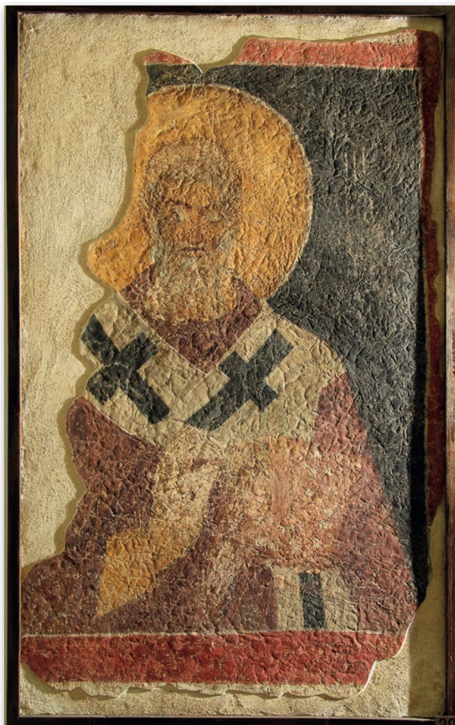
Обр. 4. Св. Лъв, папа Римски, източна стена на прохода между бема и протизис (по К. Георгиев)