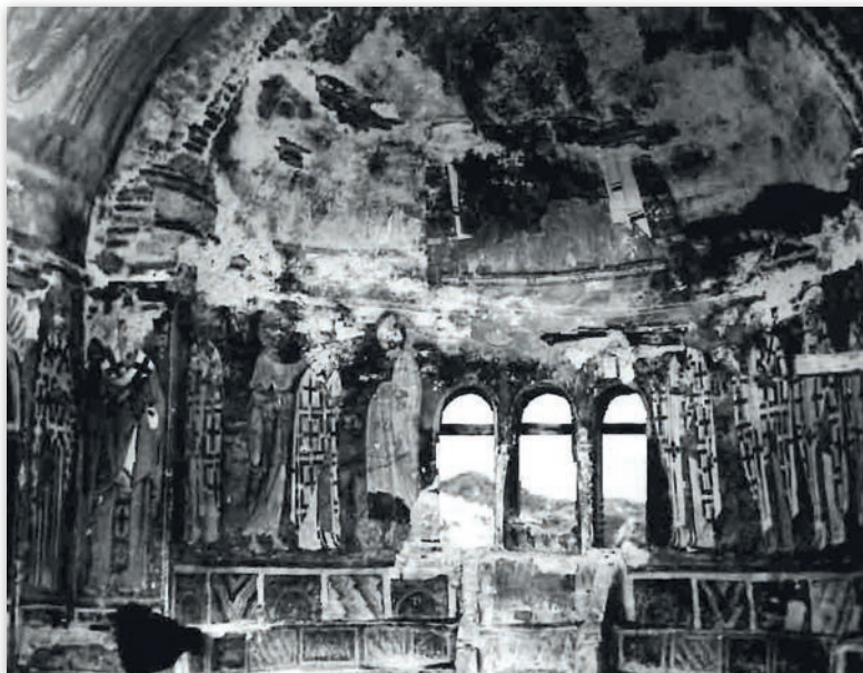
Обр. 3. Ръкополагане на епископ. Стенопис от централната апсида на църква „Св. Никола“, първи регистър (по А. Странски – Б. Тодич)